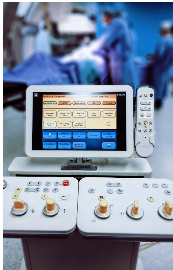
Konsola angiografu Phillips AlluraFD – stanowisko pracy technika na sali hybrydowej

Praca techników elektroradiologii przy ww. zabiegach zaczyna się od przygotowania dla operatorów odpowiednich obrazów z wcześniejszych badań obrazowych, które później można wyświetlać na monitorach operacyjnych. Przygotowanie to może polegać na wykonaniu od podstaw przestrzennych rekonstrukcji naczyń krwionośnych lub na imporcie odpowiednich serii obrazów z archiwum IM-PAX. Naszym kolejnym krokiem przed rozpoczęciem zabiegu jest montaż i odpowiednie umiejscowienie ołowianych osłon ograniczających promieniowanie, a także montaż lub demontaż (w zależności od zabiegu) elementów nieprzeziernych stołu (jak np. zagłówki). Przygotowujemy też do pracy i programujemy automatyczny wstrzykiwacz kontrastu.